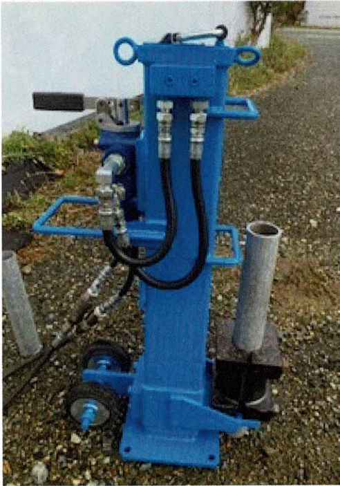
油圧杭抜き機（プルデバイス）

仕様（スペック）型式MK G 001 外形寸法（mm）690 x 195 x 330 作動油圧（MPa）11.5 許容圧力（MPa）21.0 最高圧力（MPa）22.0 単管対応径（mm）48.6～38.0 接続金具 3/8インチカプラ 動作働き範囲最大400mm 11.5mpa 作動時引き抜き力2600kg 特許出願中